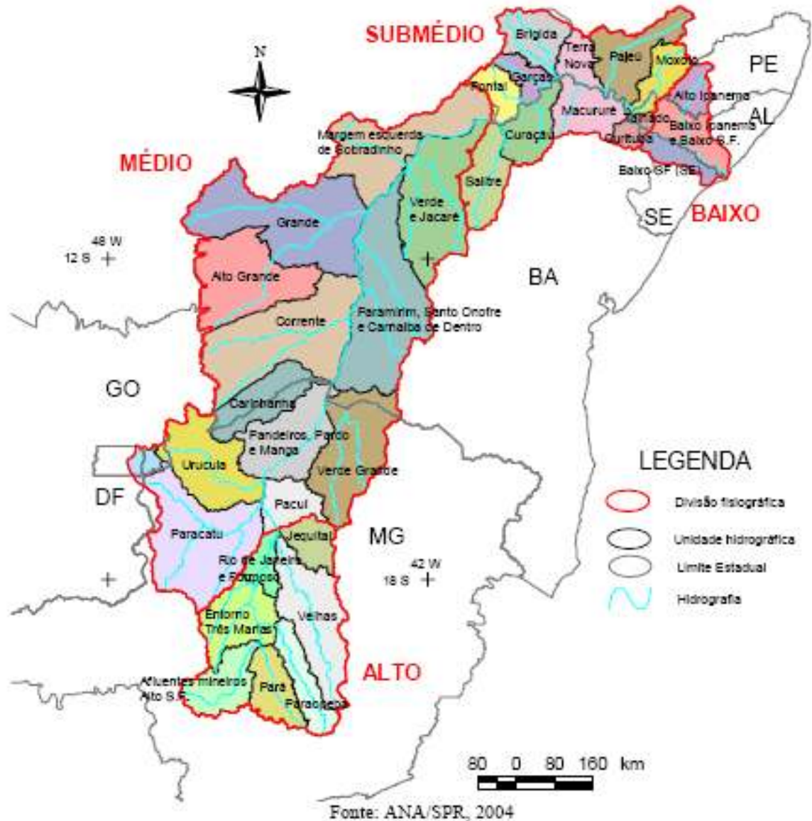
Figura 1 - Unidades Hidrográficas de Referência e Divisão Fisiográfica da Bacia do Rio São Francisco

18. A região do Semi-árido abrange 57% da área total da BHSF, com cerca de 361.825 km 2 , compreendendo 218 municípios e mais de 4.737.294 habitantes, sendo 52,4% população urbana e 47,6% rural.