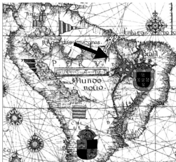
Figura 1 – Detalhe da “Carta Altântica e do Pacífico Oriental”, ca 1681. Reparar a inserção de uma suposta lagoa na região amazônica.

plorado, e, nesse sentido, acreditavam que existia, na cabeceira de diversos rios que desaguavam no oceano Atlântico, uma lagoa “mágica”, a qual, pondera Holanda (2000, p. 68), “se deslocava frequentemente segundo a caprichosa fantasia dos cronistas, cartógrafos, viajantes ou conquistadores”. Essa lagoa (veja uma de suas supostas localizações na FIG. 1), de nome também variável – Lagoa Dourada, Eupana, Upavuçu (Holanda, 2000, p. 48) –, conteria enormes riquezas.