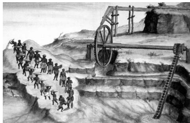
Figura 2 – Detalhe do Rosário presente na figura “Modo como se estrai o ouro no Rio das Velhas e demais partes que à Rios”, ca. 1780.

essas máquinas hidráulicas utilizadas na mineração provavelmente foram adaptadas dos engenhos de cana, uma vez que estes vieram antes do que aqueles.