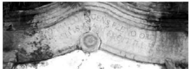
Figura 4 – Resquícios da inscrição latina do Chafariz dos Contos. Fotografia de Alberto Fonseca (Dez/2003).

Dizem os moradores do Morro do Pau Doce desta vila que eles [ilegível] desta parte se acham na pacífica posse da quarta parte da água que sai da mina do mesmo morro para seus usos, além da extração do ouro, seguindo as mais partes para os moradores da rua das Cabeças até os da ponte do Rosário; e porque desta mesma se tem extraviado grande parte para casas particulares, necessariamente se há de experimentar falta no publico (...) e porque não é da intenção deste Senado lesar a uns para utilizar a outros; e como é constantemente sabido terem os suplicantes aquela porção de água; a vosmecê pertence a conservação dela. (Representação... 1806)