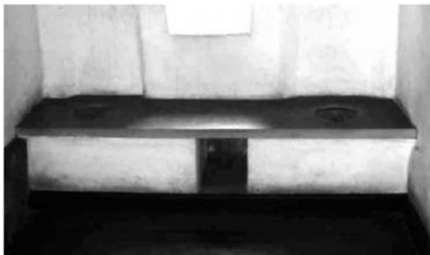
Figura 1 – Cômodo higiênico, evidenciando dois assentos sanitários em madeira (Casa dos Contos, Ouro Preto, MG).

Segundo Oliveira, no Rio de Janeiro, a concessão do direito de canalizar as águas dos aquedutos públicos para as casas de particulares só se deu em 1840 (Oliveira, 1991, p. 45 apud Castro, 2003, p. 35). Nos documentos pesquisados, porém, foram identificados requerimentos particulares de água pública em Vila Rica já na década de 1780.