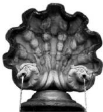
Figura 3 – Carranca do chafariz dos Contos.